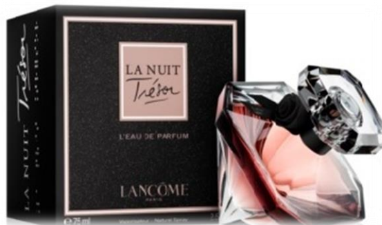
„Lancôme La Nuit Trésor“ (парфюмна вода за жени)