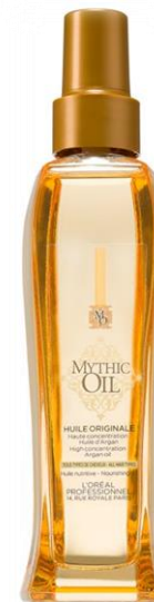
Масло за всички видове коса : “L'Oréal Professionnel Mythic Oil“