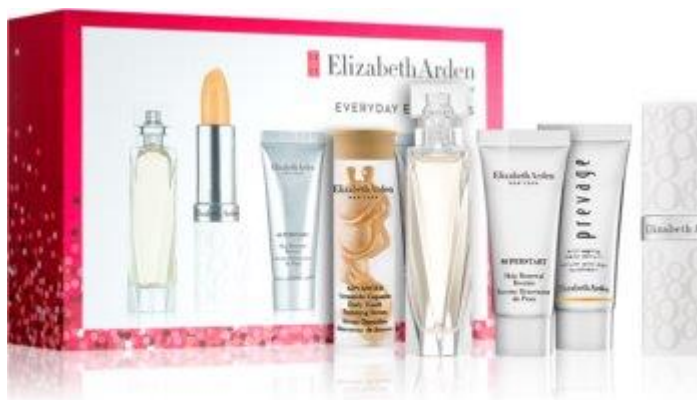
Козметичен комплект: „Elizabeth Arden Superstart“